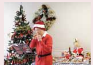
手づくりオカリナ&サンタ帽で登場されたがんサロン参加者様