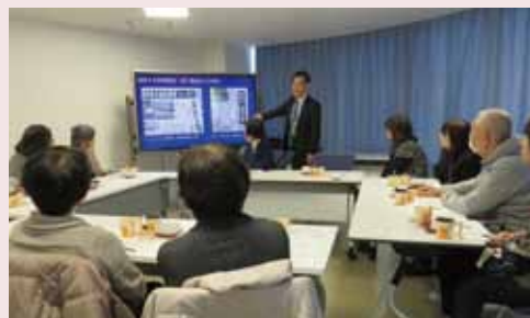
腰痛予防体操と防犯対策を説明

家族会を通じ、今後も当苑の体制や施設の雰囲気、介護に役立つトピックスなどをご家族にお伝えできればと思います。次回は、利用者様にお配りしておりました「満足度アンケート」の結果報告と、そこで指摘された問題の改善策をお伝えします。