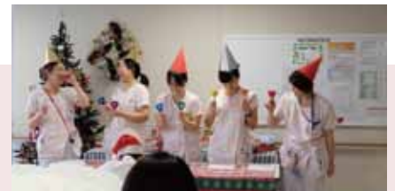
たどたどしいスタッフのハンドベルもご愛敬

その後はサンタに扮したスタッフがソリに見立てた赤色の台車に乗って登場し、お一人おひとりにクリスマスプレゼントを手渡し。お孫さんがいらっしゃり相好を崩されている患者様、スタッフと旧交を温める退院された患者様なども見られ、和やかな会となりました。