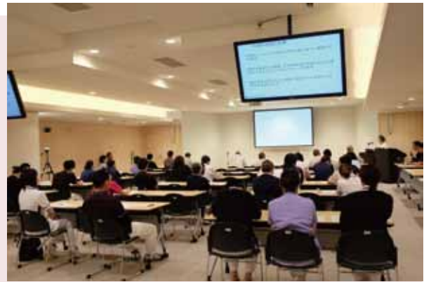
来年以降の参考に他部署の改善を聴講

吹田徳洲会病院と介護老人保健施設 吹田徳洲苑は毎年、部署ごとに業務改善計画を立て、その活動成果を院内で発表、もっとも改善に意欲的だった部署を表彰する取り組みを行っています。まず8～11月にかけて事務、老健、コメディカル、看護部など部署ごとに分かれて予選会を開催し、とくに優秀だった8チームが11月18日に開催した本選に臨みました。