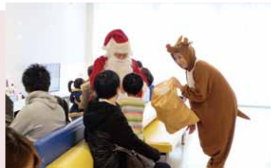
小児科外来や時間外外来前などでサンタとトナカイがプレゼントを配ります

アデランスは毎年、社会福祉の一環としてクリスマス時期に全国の病院で子どもたちにプレゼントを配っています。関西では当院を含め5病院で実施。素敵なクリスマスをありがとうございました！