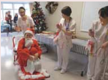
赤い台車に乗って登場したスタッフ扮するサンタ

緩和ケア病棟の 12 月のイベントはクリスマス会。患者様やご家族など 25 人以上が参加し、ノンアルコールビールやジュースで乾杯。チキンやケーキ、各種お菓子を頬張りながら、スタッフによるハンドベルや、がんサロン参加者