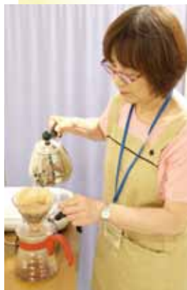
一杯ずつサポーターの方が丁寧にコーヒーを淹れています

メニューは液体だけでなく、とろみやゼリーでも提供しており、事前予約制（一杯54円）で、スタンプカードにあらかじめ注文メニューを細かく書いているため、当日はカードさえ見れば、各人の好みや嚥下機能に合わせた飲み物が出てきます。