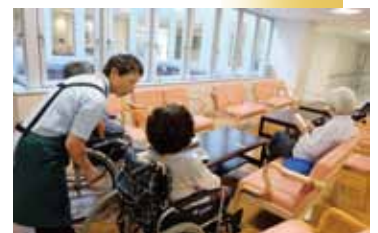
利用者様は飲み物とともに、読書やおしゃべりを楽しみます

老健 吹田徳洲苑の採光用の窓に面したラウンジは、月2回、介護支援サポーターの方々が開く「陽だまりカフェ」に変わります。淹れたてのコーヒーをいただけるとあって利用者様には大好評。カフェの準備が始まると、そわそわと近くで開店を待つ利用者様もいらっしゃいます。