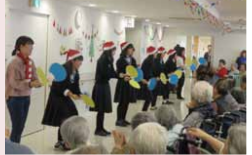
歌と踊りで盛り上がるクリスマス会

同クラブの生徒、引率の先生、OB の方々がマリンバを伴奏にクリスマスソングや踊りを披露。毎年恒例のイベントで、利用者様はお孫さんにお会いするような気持ちで、とても楽しみにされています。