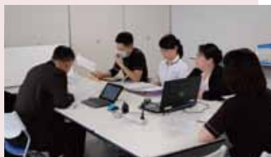
書類をもとに各部署の運用を確認

吹田徳洲会病院と老健 吹田徳洲苑は12月19日から2日間、昨年取得したISO9001（2015年版）のサーベイランスを受けました。ISO9001は3年更新制ですが、年1回、審査を受け、継続的な改善に向けたマネジメントシステムが確立されているか確認することができます。