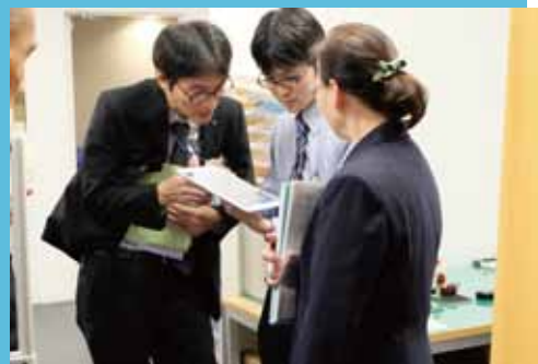
リアルタイム通訳システムはタブレット端末で利用可能