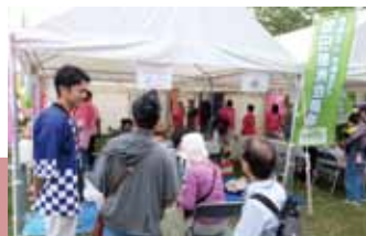
多くの方に健康チェックにご利用いただきました