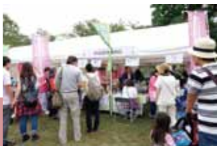
昨年秋のママ・マルシェには2日間で計1,254人の方が参加

今回も、皆様に喜んでいただけるようなブースをご用意いたします。健康に長生きするためには、何より日ごろからご自身の体調を意識していただくことが大切。ぜひこの機会に当院ブースにお足運びいただき、ご自身の健康チェックにご利用ください。