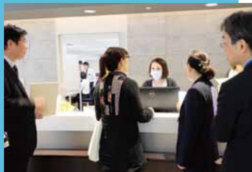
外国人が来院した際の手順を職員に質問

吹田徳洲会病院は昨年12月20日、JMIP（外国人患者受け入れ医療機関認証制度）の認証を取得しました。これは、外国人が言語や文化、宗教の違いに不安を感じることなく、安心して受診できる医療機関の整備を目的に設立された厚生労働省の支援事業です。1月17日現在、同認証を取得している病院は当院を含め全国に33病院、大阪府下に4病院のみ。訪日外国人は近年急増しており、当院でも健診を中心に外国人の利用者様が増えてきているため、これを機に体制を整備しました。