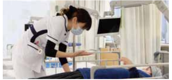
化学療法センターでは院内で行うすべての点滴の化学療法を実施

施行には専門知識が必要で、現在当院では、腫瘍内科が管理する化学療法センターで外来・入院患者様の化学療法を一括して実施。院内で施行するすべての点滴の化学療法は、徳洲会グループのレジメン(診療計画書) 審査委員会で審査、承認した標準治療(その時点で科学的根拠が確立されている最善の治療法) に沿ったレジメンに基づき行われ、その内容は主治医とともに化学療法センターの医師、薬剤師、看護師らがダブルチェック、トリプルチェックしています。