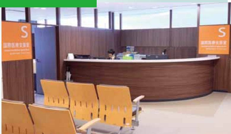
3階吹き抜けの一角に国際医療支援室を移動

同室を利用する外国の方は年々増加しており、今年はずでに1月の時点で予約数が昨年1年間の利用者数を上回るほどの勢いを見せています。現在は検診や人間ドックを利用される方が大半を占めていますが、治療を要望する声も強く、今後、院内の受け入れ体制を整えていく方針です。