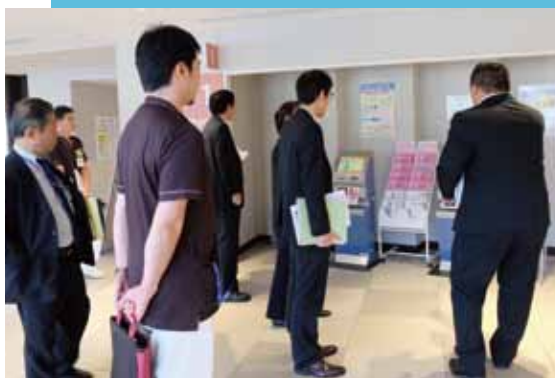
再来受付機の横には英語でメッセージも