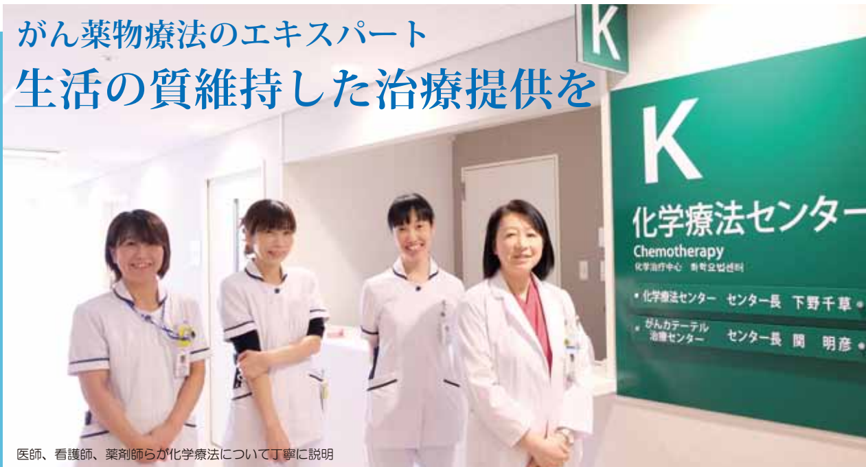
医師、看護師、薬剤師らが化学療法について丁寧に説明