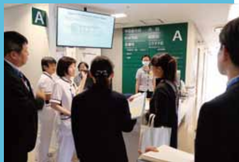
外来診療の流れを看護師が説明

大阪観光局によると17年の来阪外国人は1,000万人を超え、今後も増加する見通しです。メディカルツーリズムで訪日される方、旅先で急に具合が悪くなった方に、国籍や言語、文化、宗教の違いに不安を感じることなく医療を受けていただけるよう、スタッフ一同、今後とも尽力してまいります。