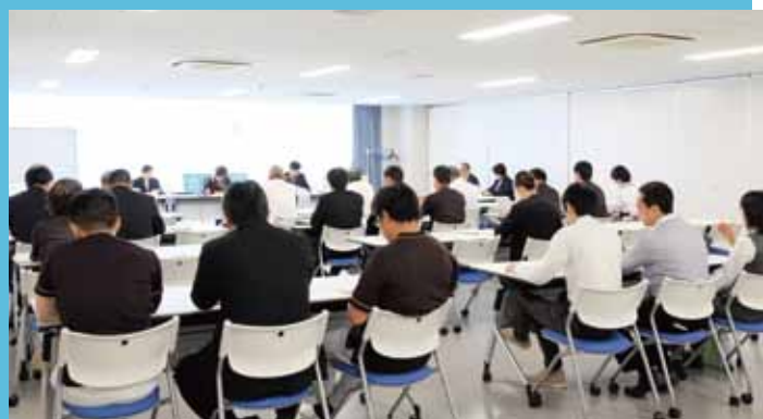
最後に審査結果を聴講、アドバイスを改善に生かします