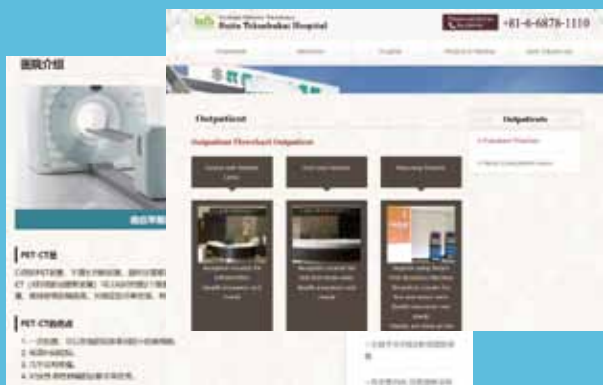
ウェブサイトも英語、中国語版を作成し情報提供