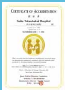
2017年2月20日に認証を取得

吹田徳洲会病院は昨年12月20日、JMIP（外国人患者受け入れ医療機関認証制度）の認証を取得しました。これは、外国人が言語や文化、宗教の違いに不安を感じることなく、安心して受診できる医療機関の整備を目的に設立された厚生労働省の支援事業です。1月17日現在、同認証を取得している病院は当院を含め全国に33病院、大阪府下に4病院のみ。訪日外国人は近年急増しており、当院でも健診を中心に外国人の利用者様が増えてきているため、これを機に体制を整備しました。