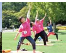
昨年秋はピンクリボン大阪の皆様と協力イベントも開催